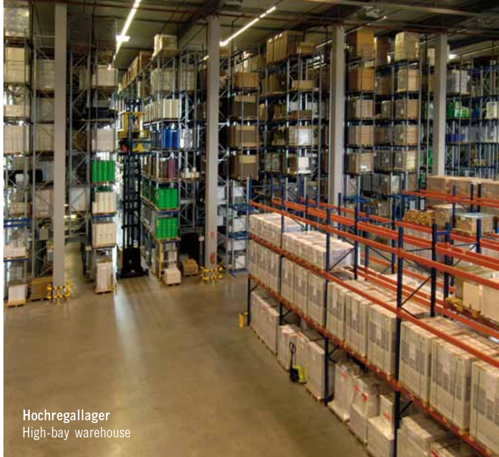
Hochregallager High-bay warehouse

Since its founding in 1993, POLI-TAPE Klebefolien GmbH has achieved continuous and, sectorally, above-average sales increases. Major contributors to this success are the products of the central business divisions Textile Graphics and Sign & Digital, in which POLI-TAPE has established itself as a leading supplier in the market.