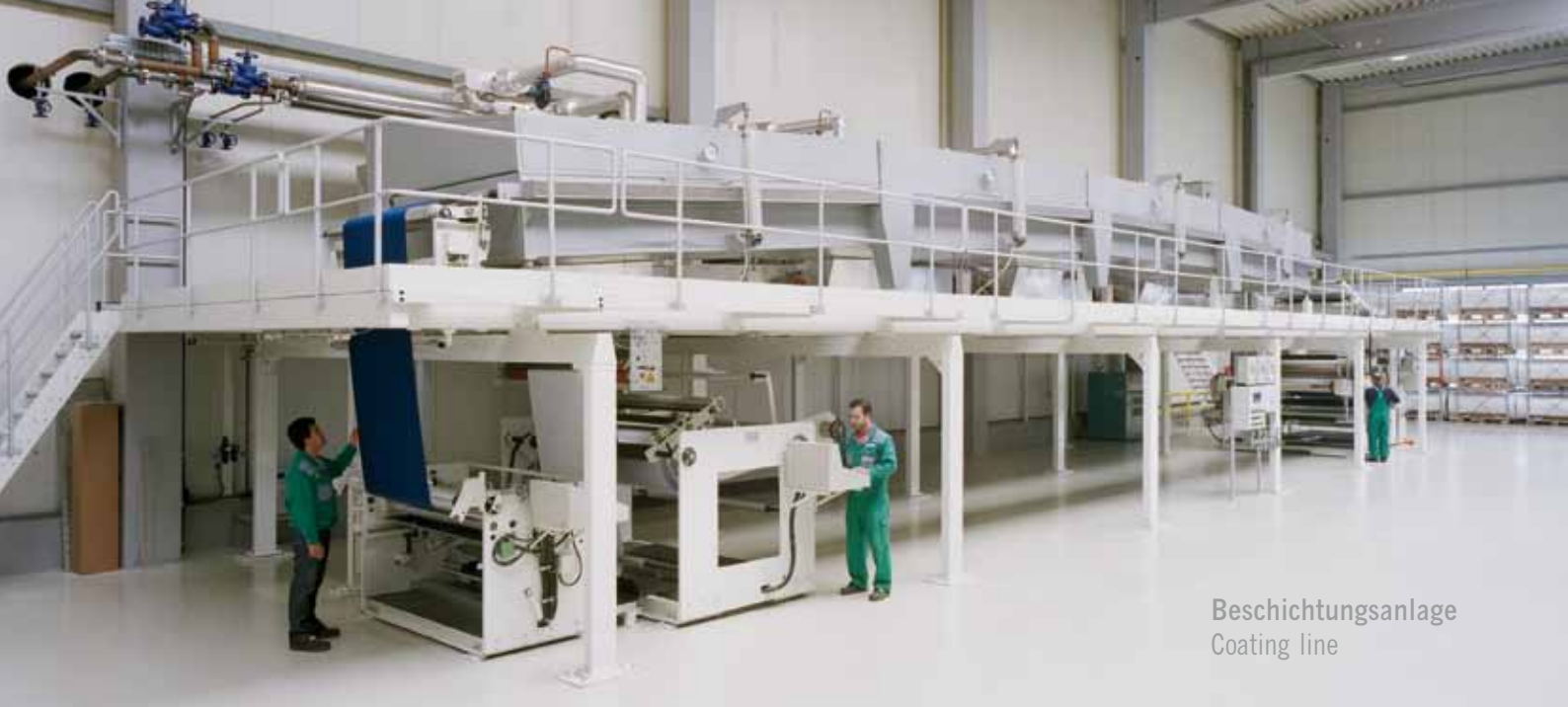
Beschichtungsanlage Coating line