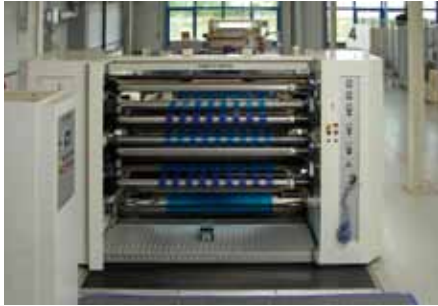
Wickelautomat Slitting machine