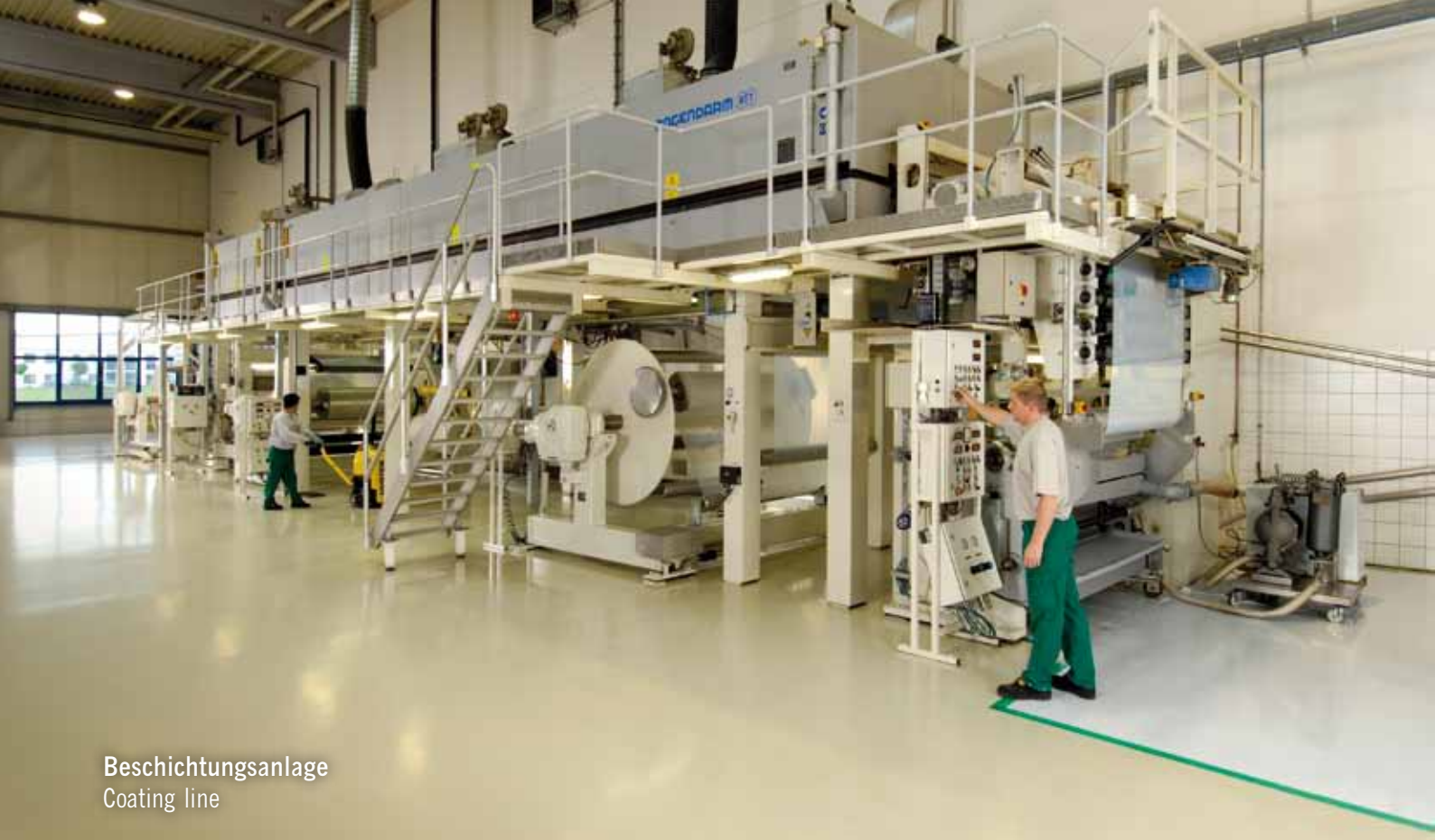
Beschichtungsanlage Coating line