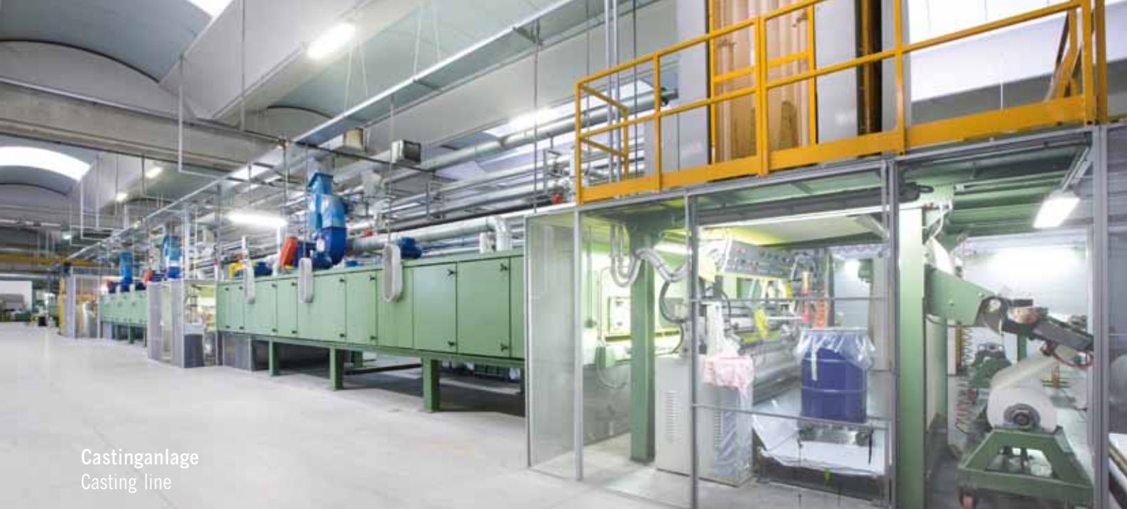
Castinganlage Casting line